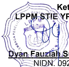
Ketua LPPM STIE YPUP Makassar

Disahkan di : Makassar Pada Tanggal : 18 Maret 2021